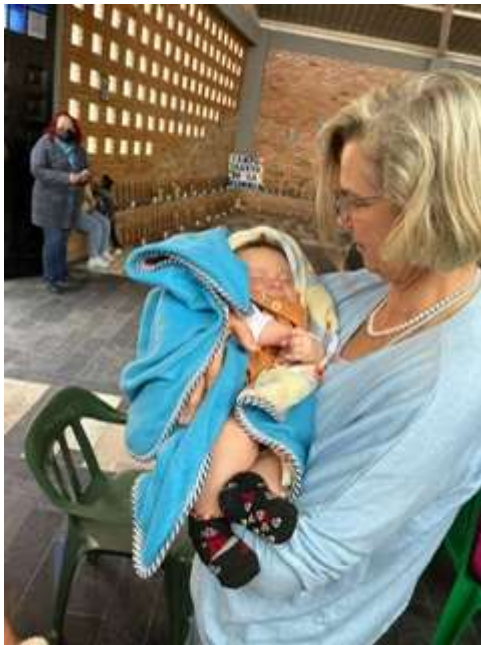
Ein kleines Menschenkind in der Kirche von Cazucá

Martin Reck: Die Herzlichkeit, Fröhlichkeit, Offenheit der Menschen. Da war zum Beispiel der Gottesdienst in Cazucá. Plötzlich legt eine junge Mutter meiner Frau ihr Baby in den Arm. Ein Zeichen, dass wir zu ihnen gehören. Da ist alles ehrlich. Da ist nichts gespielt.